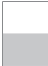
1/2 Seite quer